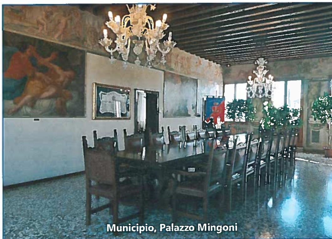
Municipio, Palazzo Mingoni

(articolo 4 del decreto legislativo 6 settembre 2011, n.149)