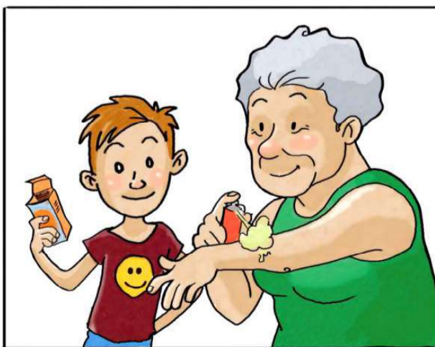
USA I REPELLENTI CUTANEI SEGUENDO LE INDICAZIONI RIPORTATE SULLE CONFEZIONI.