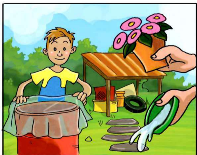
METTI AL RIPARO DALLA PIOGGIA TUTTO CIÒ CHE PUÒ RACCOGLIERE ACQUA.

(*) Leggi attentamente le istruzioni riportate sulle confezioni.