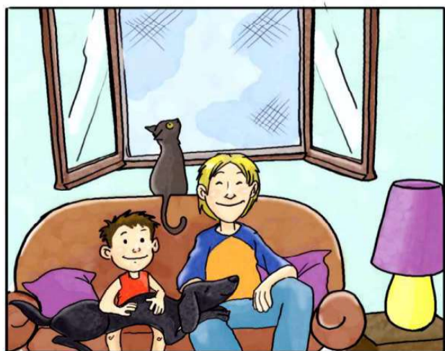
IN CASA USA LE ZANZARIERE ANZICHÉ ZAMPIRONI E FORNELLETTI.